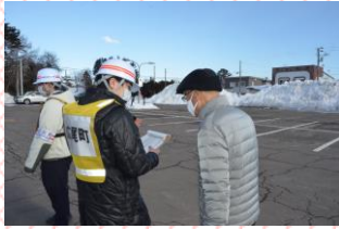
防災訓練の様子（企画課）