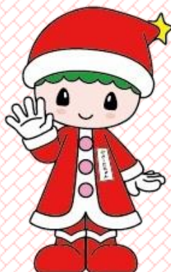
広尾町のイメージキャラクター さーたちちゃん