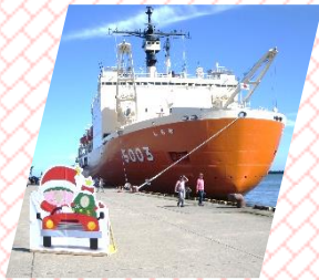
大型艦艇寄港に伴う歓迎事業（総務課）