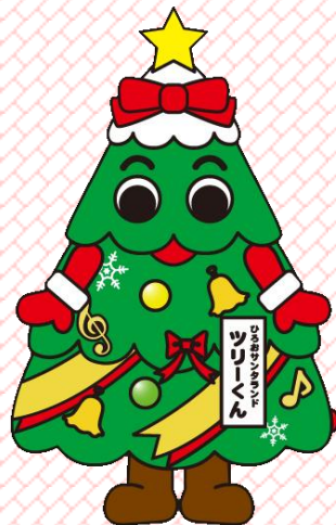
広尾町のイメージキャラクター ツリーくん