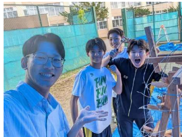
・ 学校祭での行燈作成に参加